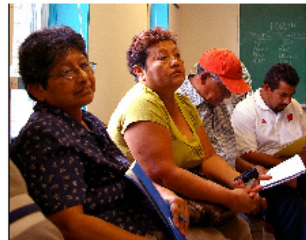
Taller de lideres

Miembros de CEUS asisten a la marcha del dia primero de Mayo en Union City.